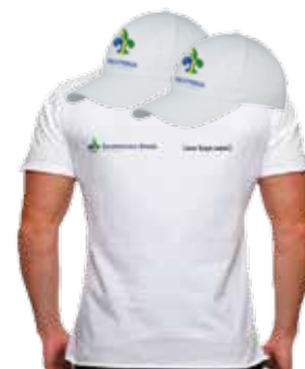
CAMISETA E BONÉ