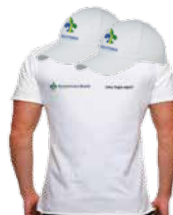
CAMISETA E BONÉ