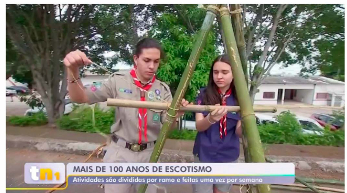
TEM Noticias, Movimento Escoteiro