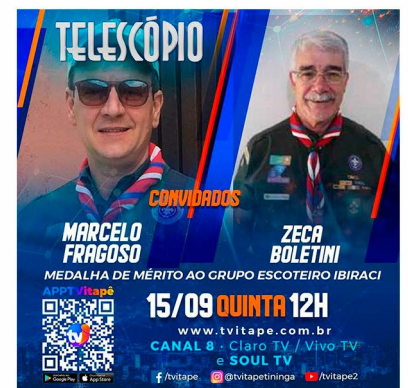
TV Itapetininga, Telescópio - Grupo Escoteiro Ibiraci

As entrevistas em rádios podem acontecer tanto de forma presencial, quanto virtualmente, no formato ao vivo ou gravado. Tradicionalmente, essa é uma plataforma que tem um maior enfoque na fala, embora às vezes possa ser acompanhada por uma transmissão em vídeo, por isso devemos estar preparados para transmitir as informações da forma mais atrativa possível. Uma boa prática é levar um material de apoio, como um bloco de notas com os principais tópicos e pontos importantes a serem abordados.