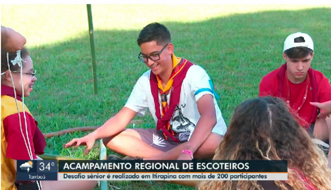
Jornal da EPTV, Desafio Sênior em Itirapina