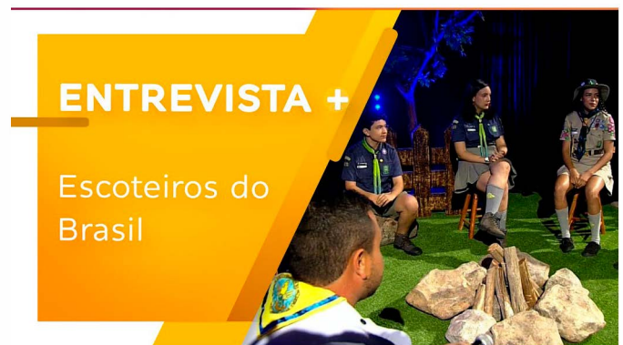
Quarta Show, Escoteiros do Brasil