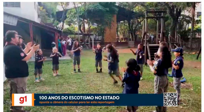
G1, 100 anos do Grupo Escoteiro São Paulo