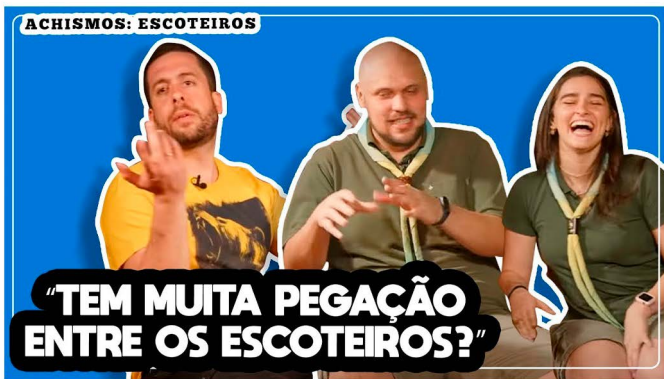
Youtube, Escotismo com Mauricio Meirelles

São portais, canais e até mesmo redes sociais. O meio on-line é conhecido por ser um espaço bem diverso em conteúdos. No caso de um podcast ou conteúdos para redes sociais , é possível ter um pouco mais de descontração no assunto abordado, o que deixa o ambiente ideal para a participação dos jovens. No caso de canais do YouTube , as entrevistas costumam ser bem parecidas com as da TV. Não existe um direcionamento específico para cada uma dessas plataformas, por isso, ressaltamos novamente a necessidade de alinhar com o veículo sobre a pauta e enfoque da entrevista.