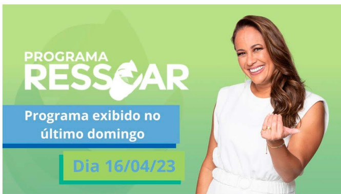
Programa Ressoar, As modalidades no Escotismo Brasileiro

Geralmente são marcadas com antecedência pelos veículos, assim é possível definir um horário, local e até mesmo preparar outros detalhes, como a organização do uniforme ou outros itens que serão mostrados durante a entrevista. Os veículos costumam chegar com alguns minutos de antecedência ao local para montarem o equipamento. Durante este tempo, é interessante repassar todo o conteúdo do media training e até conversar com o entrevistador para entender melhor a pauta.